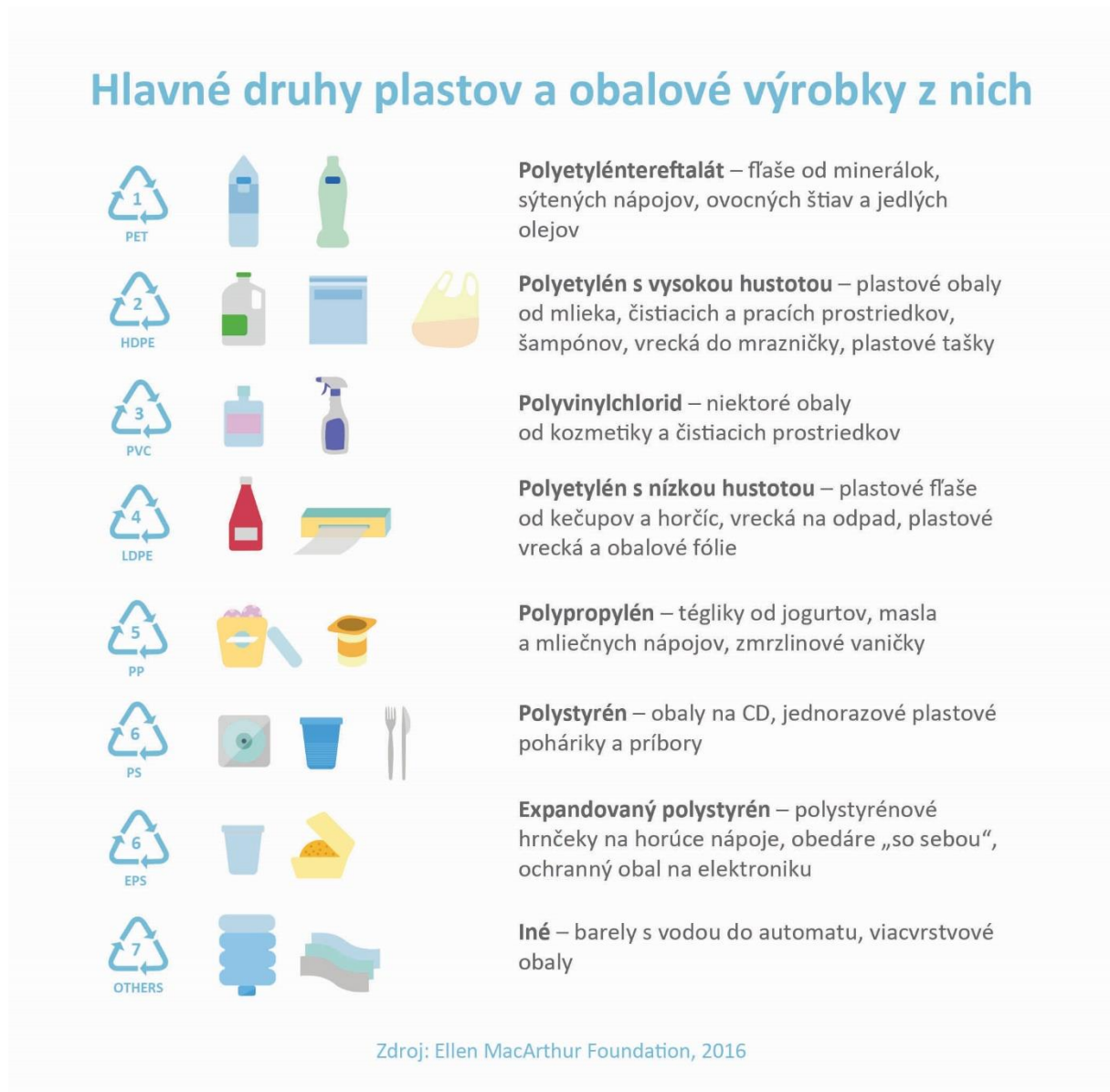
Obr. 2: ZDROJ: Ellen MacArthur Foundation, 2016

stopu“. Počas jedného roka tak dôkladne odkladal každý kúsok plastového odpadu, až nazbieral neuveriteľných 4 490 položiek!